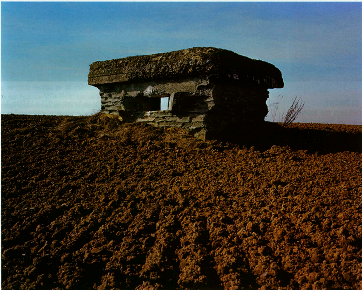
Bertrand Carrière Tiré de Chemins de cendres , installation vidéo, 9 mn 40 s 2 écrans Bunker anglais, Auchonvilliers, Somme, Picardie, France, 2008 Tirage au jet d'encre

Bertrand Carrière recherche par l'utilisation de la vidéo l'apport du mouvement, de la durée et de l'expérimentation sonore. Dans sa partie filmée, le cadre très long se présente comme en cinémascope où des micro-événements se produisent, il en est ainsi, par exemple du vent qui transporte des choses ou des animaux qui entrent et qui sortent de l'écran. Dans sa partie fixe, l'image invite à la réflexion car sa lecture s'effectue différemment de la lecture cinématographique. C'est ce rapport entre les 2 médiums que Bertrand Carrière explore de brillante façon, à partir du dispositif que lui permet l'installation.